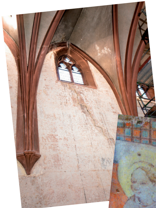
Vor der Renovierung: Risse im Mauerwerk

Mittelalterliche Malereien warten noch auf Ihre Freilegung, die Kirche hat nur eine provisorische Bestuhlung, eine neue Orgel soll installiert werden.