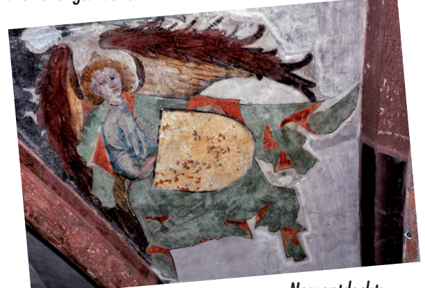
Neu entdeckt: Engelsfiguren