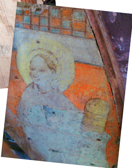
Neu entdeckt: Maria Magdalena